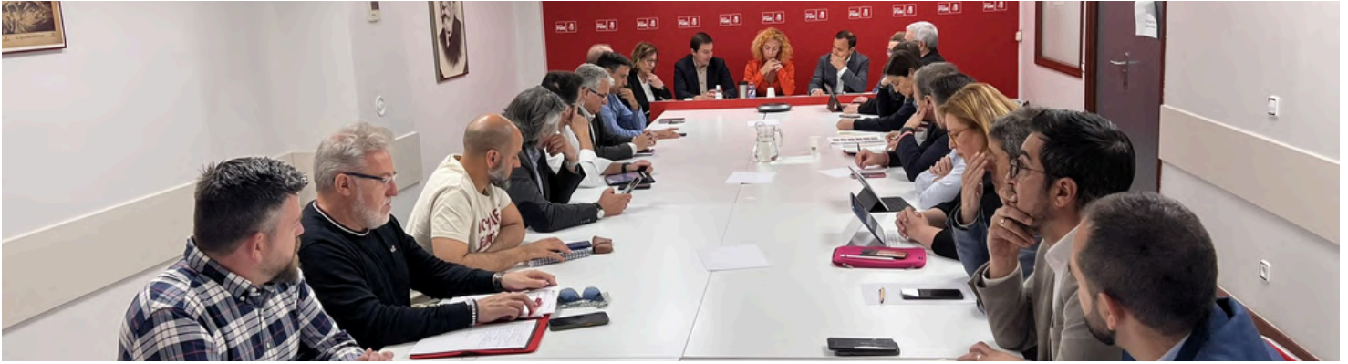
Alcaldes/as y portavoces en el Consejo del 17 de abril de 2024

El Consejo de Alcaldes, Alcaldesas y Portavoces Socialistas de Madrid ha emprendido una iniciativa para abordar la crisis de vivienda en la región. Su objetivo es impulsar una Iniciativa Legislativa Popular desde los ayuntamientos para la aplicación efectiva de la Ley de Vivienda en Madrid y reducir los precios del alquiler, especialmente para jóvenes y familias.