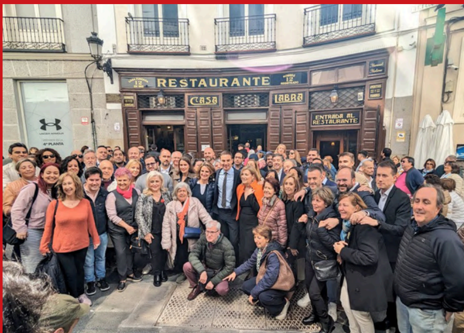
Los/as Socialistas Madrileños en Casa Labra celebrando el 145 aniversario de la Fundación del PSOE

Conmemoramos los 145 años del PSOE. El 2 de mayo de 1879, Pablo Iglesias Posse fundó el partido en Casa Labra. Desde entonces, el PSOE ha sido un pilar fundamental en la historia de España, dedicado al servicio del país y comprometido con la lucha por la libertad, el progreso, la igualdad y la justicia social. A lo largo de estos años, el partido ha enfrentado numerosos desafíos, pero siempre ha mantenido su firmeza en la defensa de los valores que lo inspiraron en su fundación. A pesar de los obstáculos, el PSOE continúa su camino con determinación, consciente de que aún queda mucho por hacer en la construcción de una sociedad más justa y equitativa. En este aniversario, reafirmamos nuestro compromiso con los ideales que nos han guiado durante más de un siglo y medio. ¡Seguimos adelante, con fuerza y convicción!