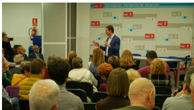
Asamblea de Alcorcón