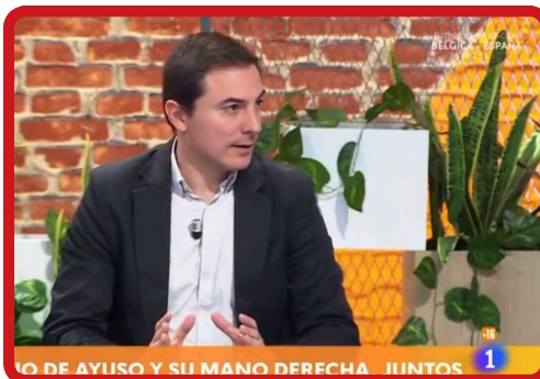
mañaneros MAÑANEROS TVE »»» Ver