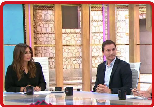
LA ROCA »»» Ver