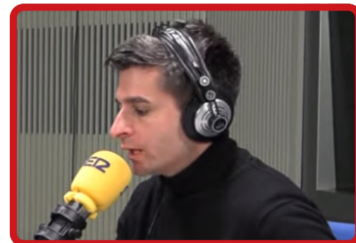
LA VENTANA LA VENTANA RADIO MADRID »»» Oír