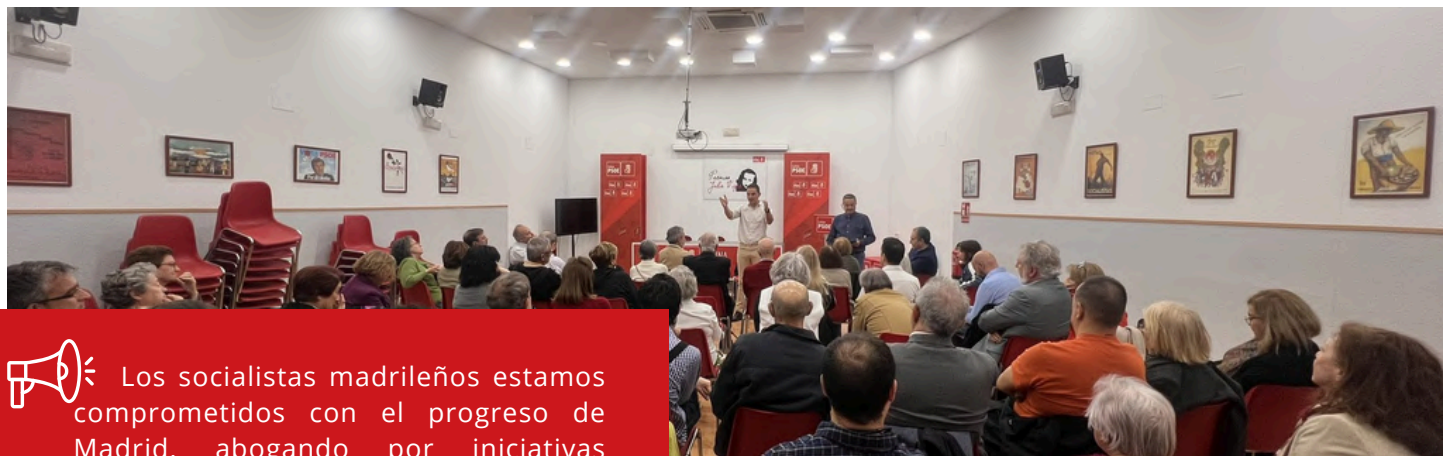
Asamblea Abierta de las Agrupaciones de La Latina y Carabanchel