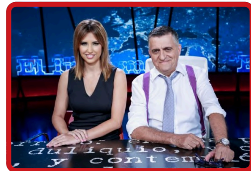
EL INTERMEDIO INTERMEDIO »»» Ver