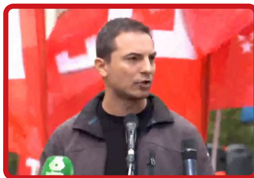
INFORMATIVOS NACIONAL »»» Ver