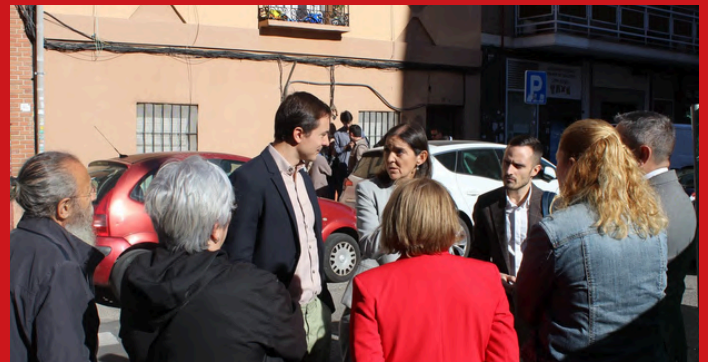
Juan Lobato y Reyes Maroto en una visita al barrio de Puente de Vallecas

La portavoz socialista, Reyes Maroto, ha criticado la política de vivienda del Ayuntamiento de Madrid, enfocada en incentivar la iniciativa privada con prácticas que generan inseguridad jurídica y no atienden las necesidades de la población. Un reciente convenio para ceder 53 parcelas ha sido señalado por la falta de registro adecuado de 26 de ellas, lo que refleja una falta de compromiso con la creación de vivienda asequible.