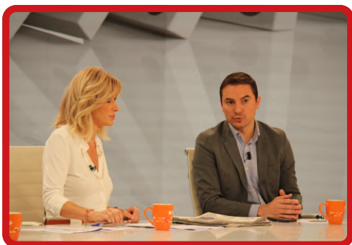
ES_p ESPEJO PÚBLICO »»» Ver