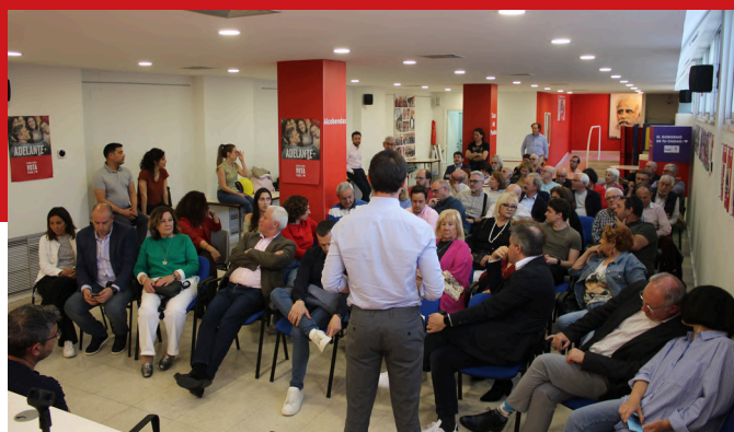
Asamblea de Alcobendas, SanSe, Tres Cantos y San Agustín