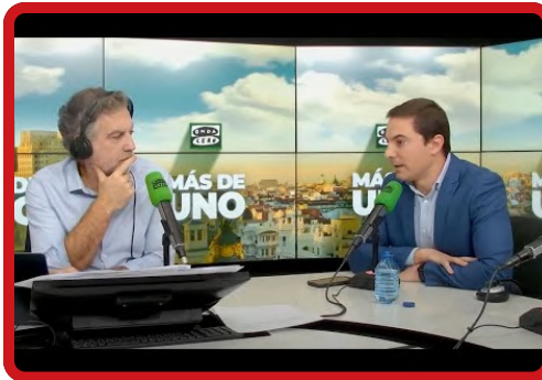
ONDA CERO MÁS DE UNO »»» Escuchar