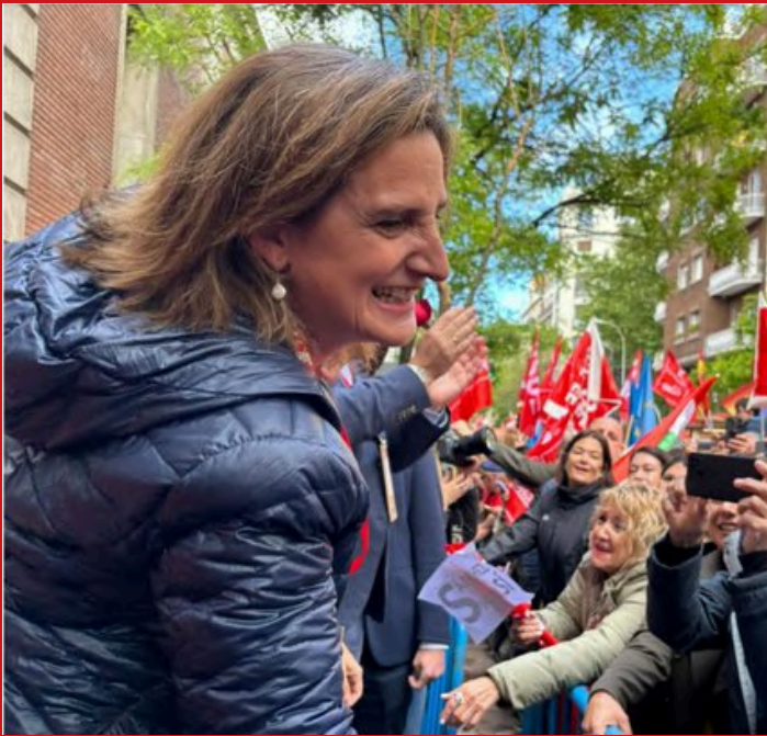
Teresa Ribera, candidata a las Elecciones Europeas

La Comisión Ejecutiva Federal del PSOE ha propuesto a la vicepresidenta tercera del Gobierno y ministra para la Transición Ecológica y el Reto Demográfico, Teresa Ribera, como cabeza de lista de la candidatura socialista a las elecciones al Parlamento Europeo que se celebrarán el próximo 9 de junio.