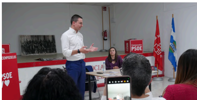
Asamblea de Ciempozuelos