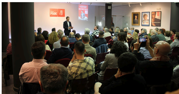
Asamblea de Centro, Chamberí y Arganzuela