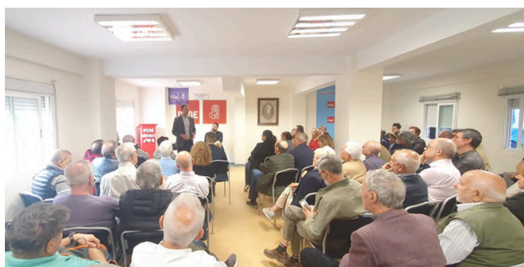
Asamblea Abierta de la Agrupación de Móstoles

Los socialistas madrileños estamos comprometidos con el progreso de Madrid, abogando por iniciativas destinadas a mejorar la calidad de vida en la región. Estos proyectos se gestan mediante un proceso inclusivo y participativo, donde se promueve un diálogo abierto con cada rincón de la comunidad, desde los barrios más urbanos hasta los pueblos más remotos. Escuchar las necesidades y aspiraciones de los ciudadanos es fundamental para elaborar propuestas que reflejen las verdaderas demandas de la sociedad.