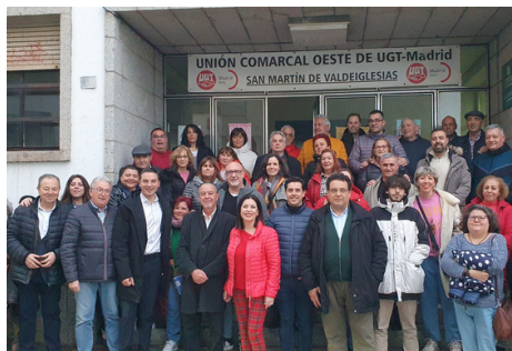
Agrupaciones Zona Oeste de Madrid