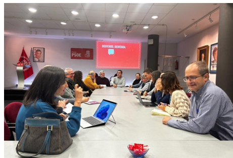
Agrupación Madrid Centro