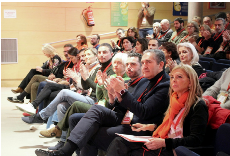
Comité Madrid Ciudad