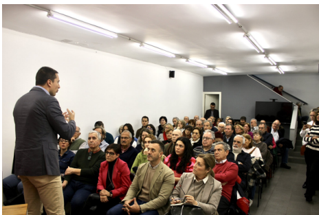
Agrupación de Chamartín