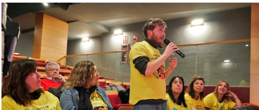
Miembros de la Plataforma Laboral por la Escuela Pública