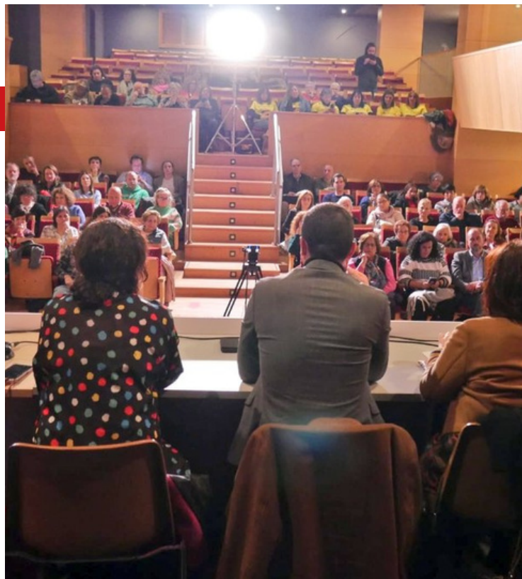
Vista del Auditorio del Centro Cultural La Vaguada (Madrid)

“ Lo que hagamos en Educación hoy va a definir qué es Madrid dentro de 10/15 años. ”