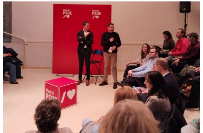
Agrupación Hortaleza y Ciudad Lineal